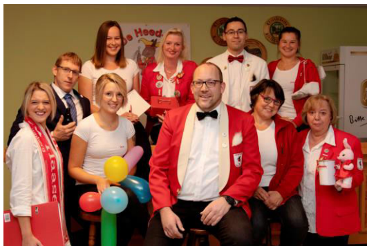
Der neue Vorstand der Heed-Haase

Weitere Formulare sind zum ausdrucken unter www.heed-haase.de zu finden und auf Facebook sind wir auch aktiv.